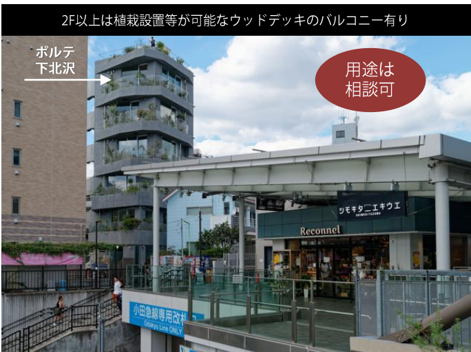
南西口の「シモキタエキウエ」から徒歩1分の視認性の高いビル

スケルトン天井の想定床～天井までの高さ3.2-3.47m、階高3.6-3.7m、窓サッシ高2.75m